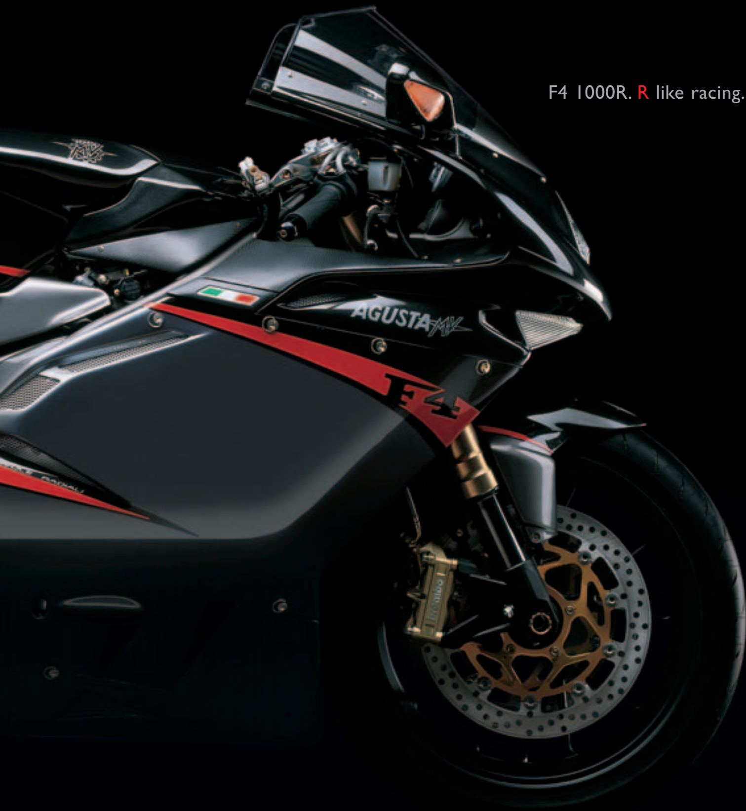
F4 1000R. R like racing.